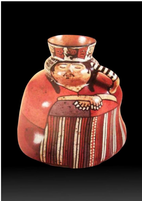
Varón obeso, luce vistosos atuendos y duerme plácidamente. Cerámica Nazca. MNAM.