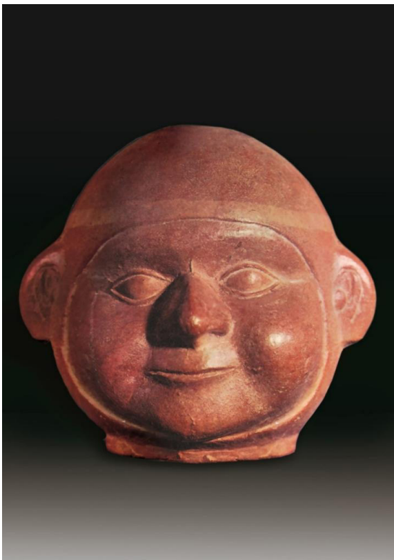
Rostro de un varón adulto obeso. Cerámica Mochica. MNAAHP.