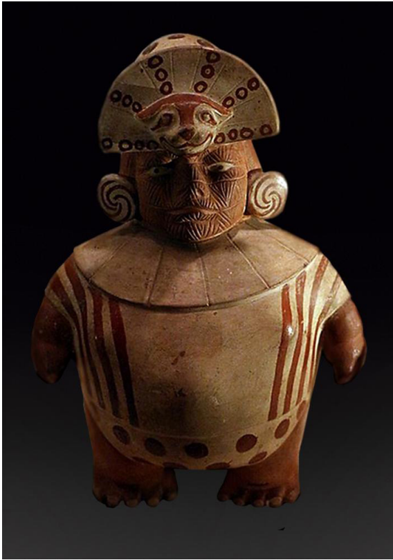
Individuo obeso con escarificaciones lineales en la cara y con turbante en la cabeza que representa un felino. Cerámica Mochica. Museo Field de Historia Natural de Chicago, EE.UU.