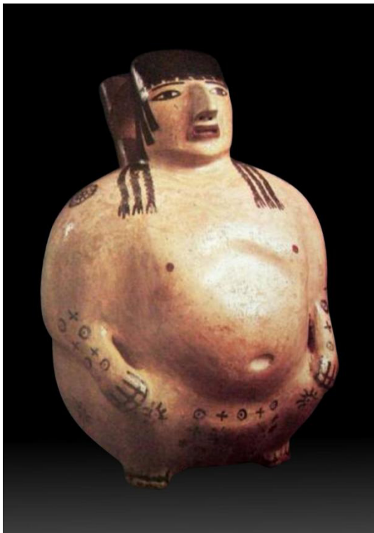
Mujer adulta obesa, desnuda, con el cráneo modificado intencionalmente y con tatuajes en los miembros superiores y pelvis. Cerámica Nazca. Museo Nacional de América de Madrid (MNAM), España.