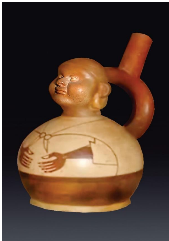
Varón adulto con obesidad. Cerámica Mochica. Museo Nacional de Arqueología, Antropología e Historia del Perú (MNAHP), Lima, Perú.