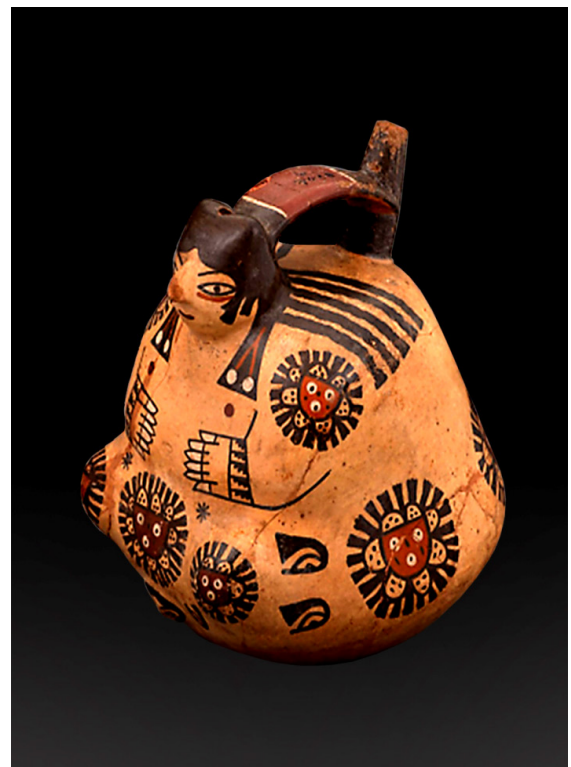
Mujer adulta desnuda afecta de obesidad, con el cráneo deformado intencionalmente, polidactilia bilateral y tatuajes en diferentes partes del cuerpo. Cerámica Nazca. MNAAHP.