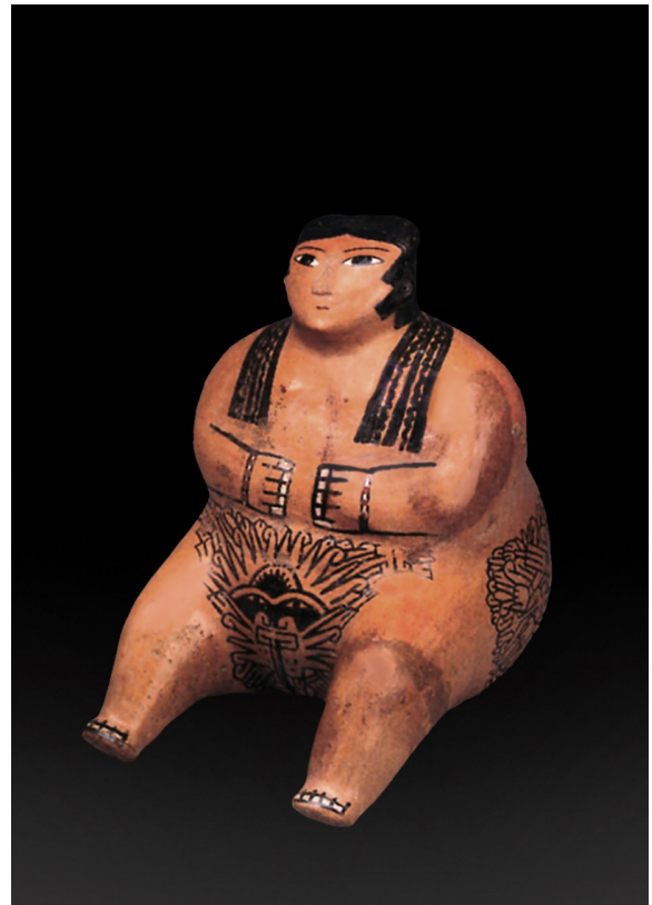
Mujer adulta con obesidad, desnuda, con el cráneo deformado intencionalmente y tatuajes en el cuerpo. Cerámica Nazca. MNAAHP.