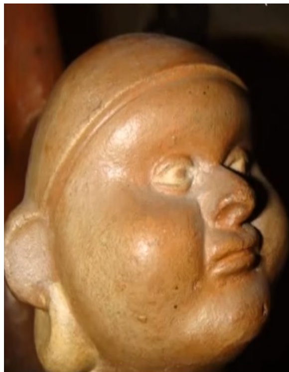
Rostro del individuo de la figura anterior. Cerámica Mochica. MNAHP.

Del estudio de ceramios que representan a personajes con obesidad que hemos realizado, dos hechos llaman la atención. Primero, los ceramios mochicas en su gran mayoría representan a varones con obesidad. Solo hemos encontrado una mujer con dicha patología. En cambio, en los ceramios nazcas, hay más representaciones de mujeres con obesidad. Segundo, la mayoría de personajes con obesidad que están representados tanto en los ceramios mochicas como en los nazcas, están bien acicalados, pues lucen vistosos turbantes, vestidos, aretes, collares, tatuajes o escarificaciones, cráneos modificados intencionalmente, signos que eran considerados de belleza, distinción social y poder.