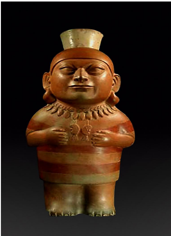
Mujer con sobrepeso y regimiento acicalada, con el miembro inferior derecho con probable edema o linfedema. Cerámica Mochica. MARLH.