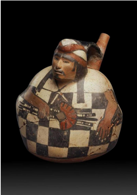
Varón obeso. Es un guerrero de alto mando que en una de sus manos sostiene armas de combate. Cerámica Nazca. Museo del Arte de la Universidad de Princeton, Nueva Jersey, EE.UU.