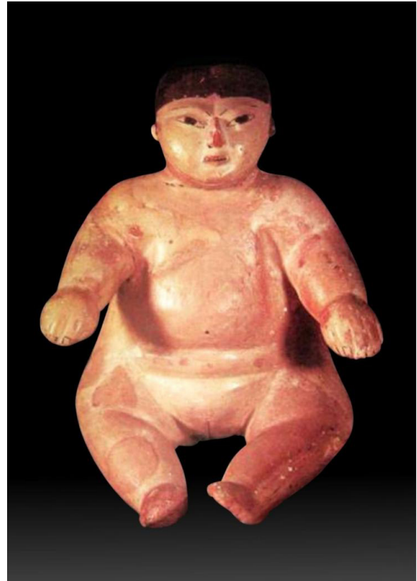
Mujer adolescente obesa, desnuda y con el cráneo modificado intencionalmente. Cerámica Nazca. MNAM.