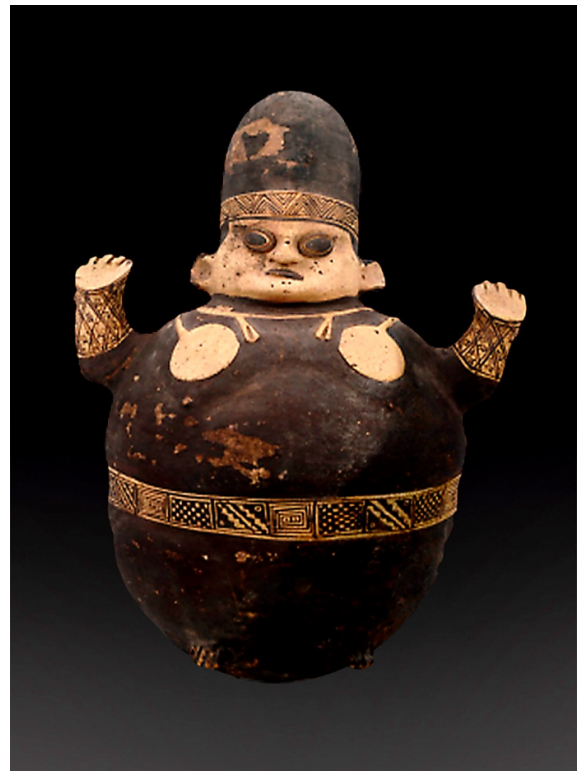
Individuo obeso, con el cráneo modificado intencionalmente y con tatuajes en los miembros superiores. Cerámica Chancay. MNAHP.