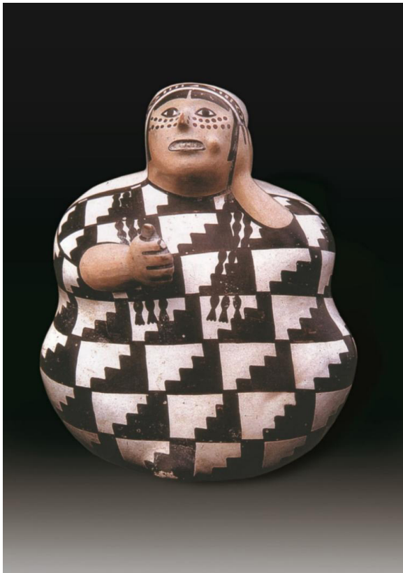
Mujer adulta obesa con tatuajes en la cara y "chacchando" coca. Cerámica Nazca. MNAHP.