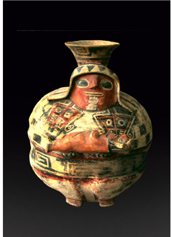
Mujer obesa con un hijo sobre sus brazos. Ella luce un hermoso turbante y un vistoso vestido. Cerámica Recuay. Museo Etnológico de Berlín, Alemania.