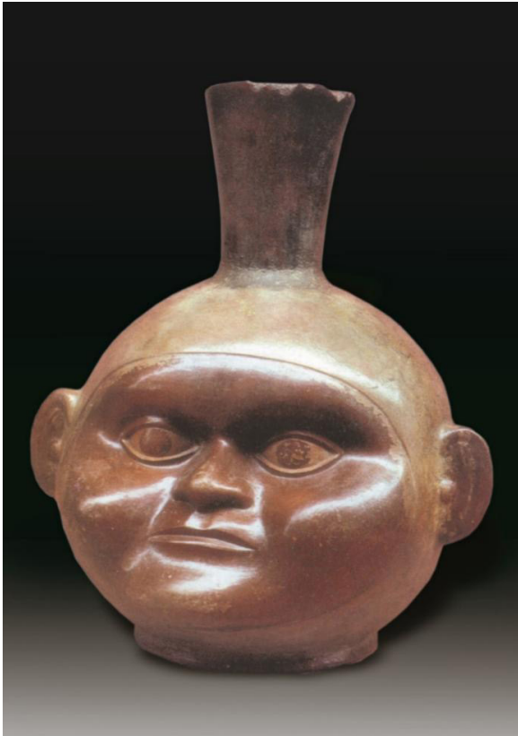
Rostro de un adolescente obeso. Cerámica Mochica. MNAAHP.