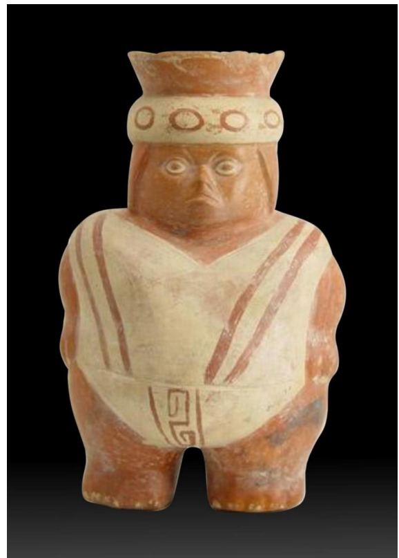
Individuo con obesidad. Cerámica Mochica. Museo Arqueológico Rafael Larco Herrera (MARLH), Lima, Perú.