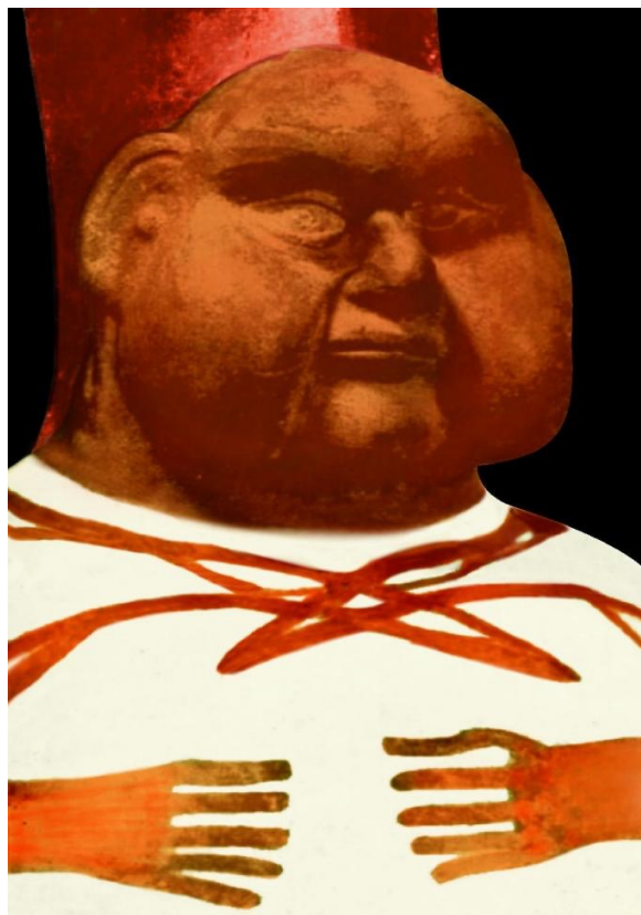
Varón adulto con obesidad. Cerámica Mochica.